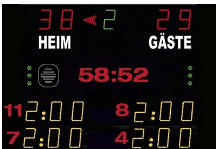
Abbildung 1: Beispiel Anzeigetafel

Das Anzeige-System in der Spielstätte muss eine öffentliche Zeitmessanlage sein, die von den Zuschauerplätzen und insbesondere vom Zeitnehmertisch ohne Einschränkungen eingesehen werden kann. Werden auf der Anzeigetafel Zeitstrafen angezeigt, so müssen mindestens zwei Hinausstellungen pro Verein inkl. Spielernummer und Strafzeit (siehe Abbildung 1) angezeigt werden können. Sollte dies nicht möglich sein, so ist bei Hinausstellungen die Zeit des Wiedereintritts inkl. Spielernummer jeweils auf einem Vordruck in Papierform einzutragen und sichtbar anzubringen.